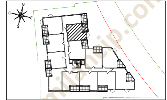
Appartement de 2 pièces n° 212 au 2 ème étage