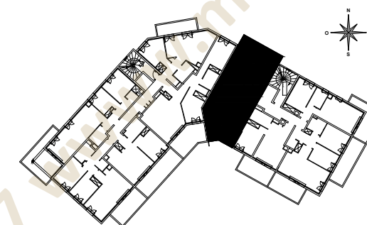
Tableau des surfaces habitables